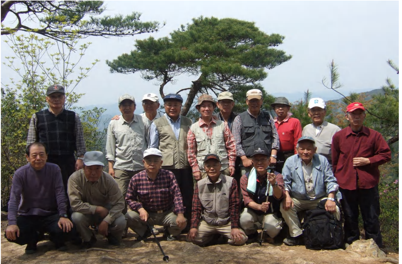
阪急・中山駅から奥之院参道を登り、夫婦岩で小休止した後中山山頂展望台で昼食。