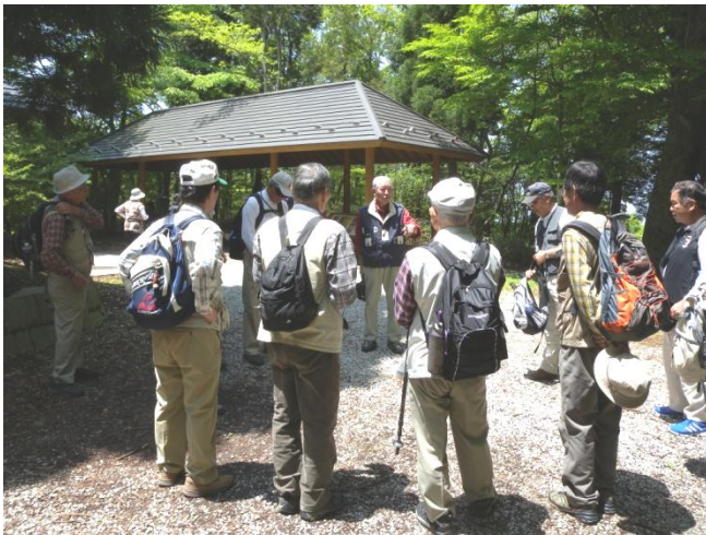
葛城山頂 会長挨拶