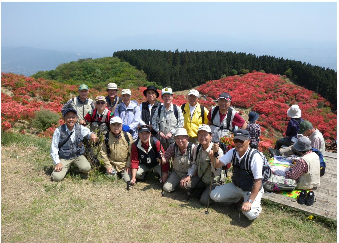
「一目百万本」と言われる野生ツツジ群生地をバックに記念撮影