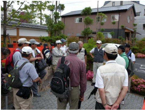
稲荷駅で会長朝礼挨拶