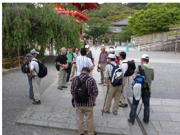
清水さんで終礼 何をゆうてはるんやろ？