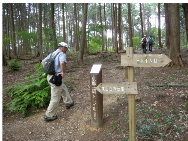
そこが清水山山頂です