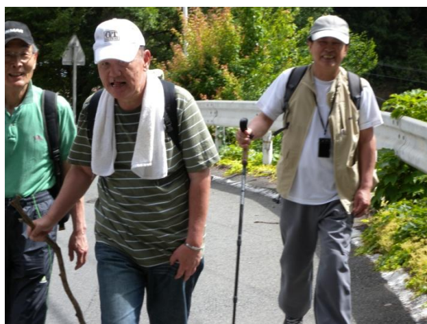
もう少しで清水(きよみず)さんです！