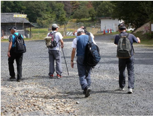
湖南アルプス出発進行！(上桐生バス停)