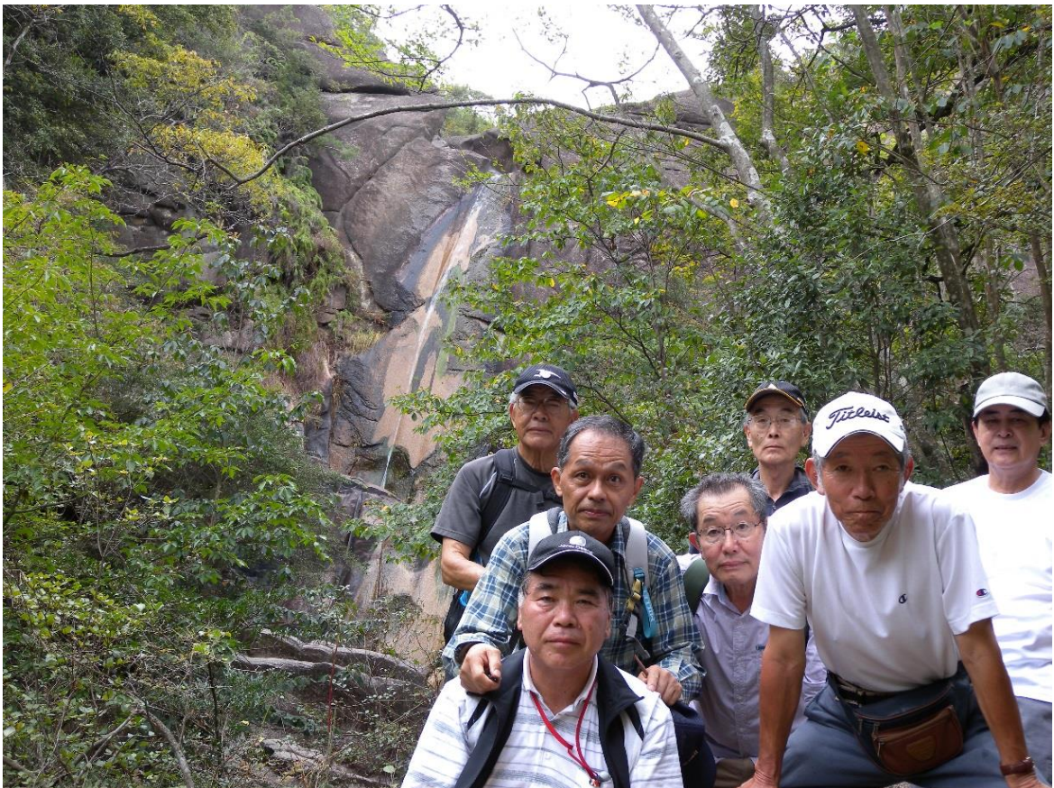
落が滝背景に記念撮影