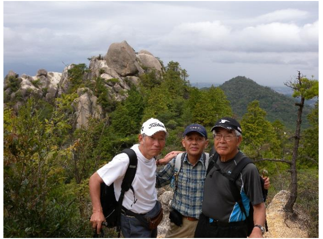
このコースは、到る所に岩盤が浸食崩壊による重ね岩が見られました。