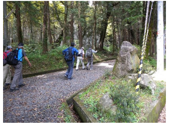
若山神社参道を行く