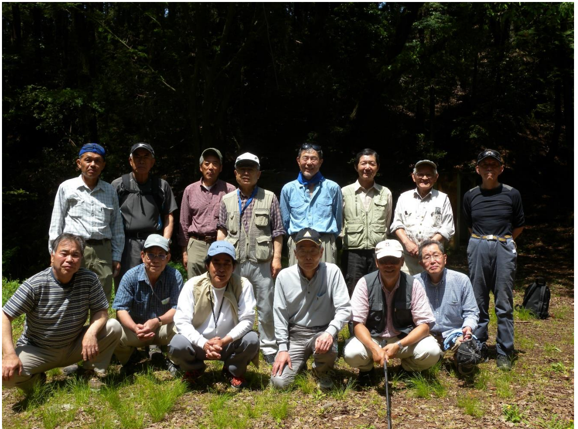
キャンプ場で昼食後記念撮影