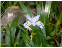
道中「シャガ草」が満開でした