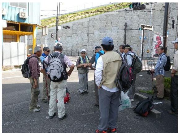
奥海印寺バス停にて終礼