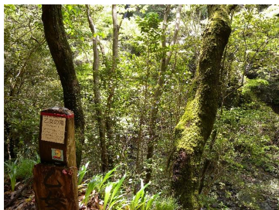
木立の向こうに滝が見えた