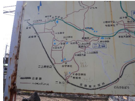
ハイキングコース