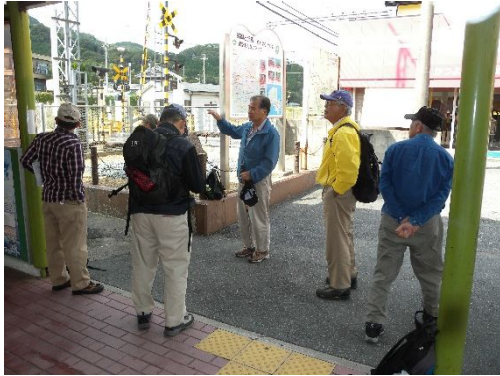
近鉄二上山駅前で朝礼