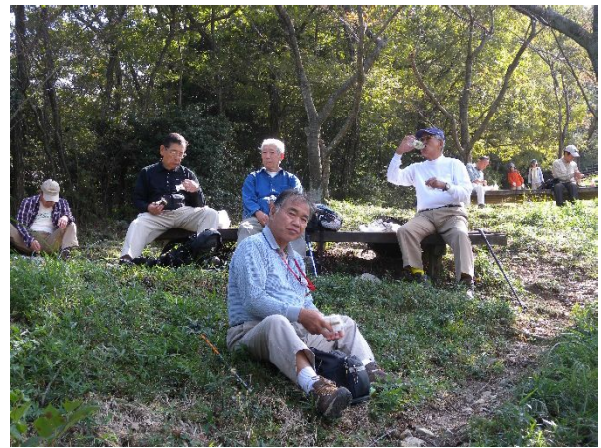
雌岳から大阪平野が見渡せました