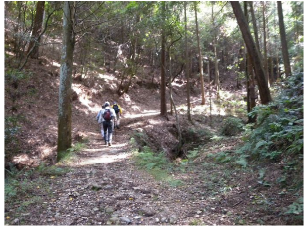
ニ上山ルートは整備され歩きやすかった