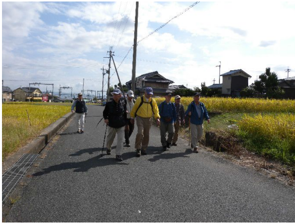
ハイキングスタート