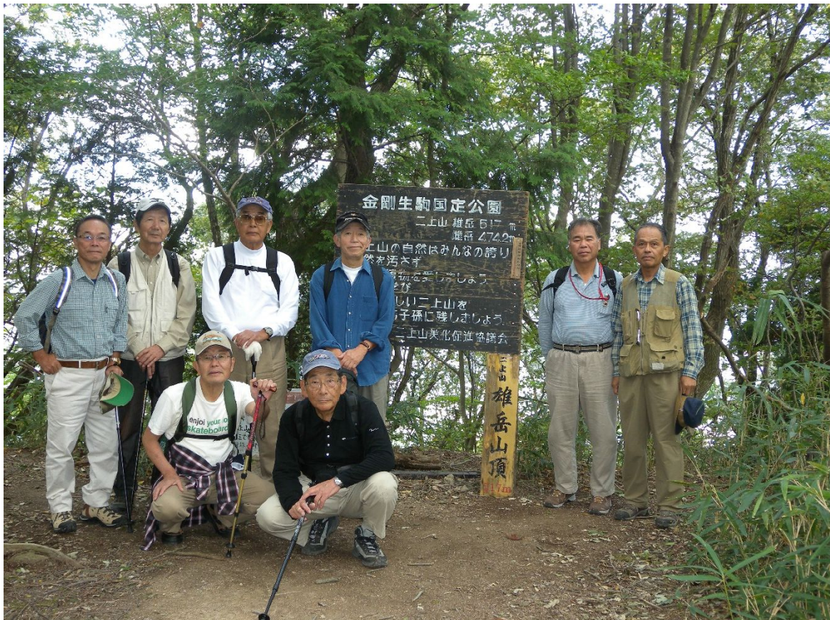
二上山雄岳山頂で記念撮影