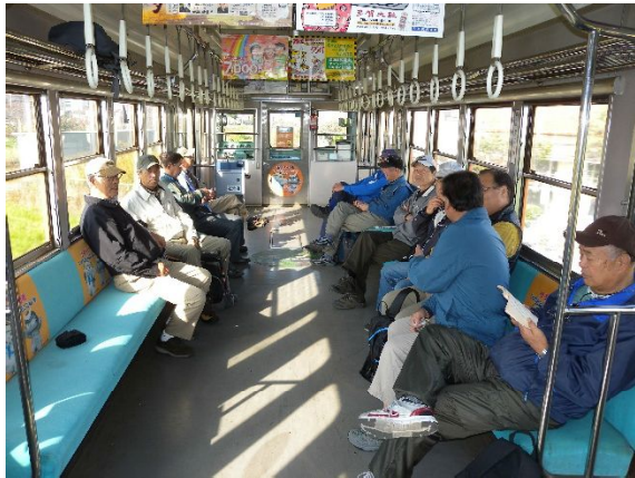
近江鉄道八日市行き貸切電車？