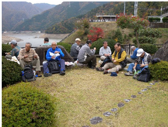
永源寺ダムでの昼食