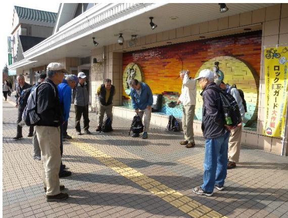
近江鉄道八日市駅前朝礼