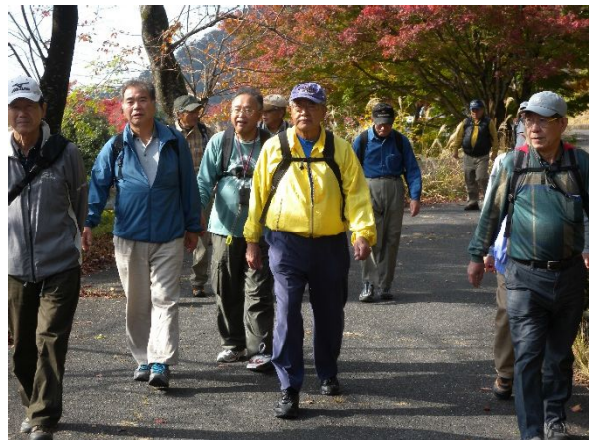
永源寺ダムサイト散策