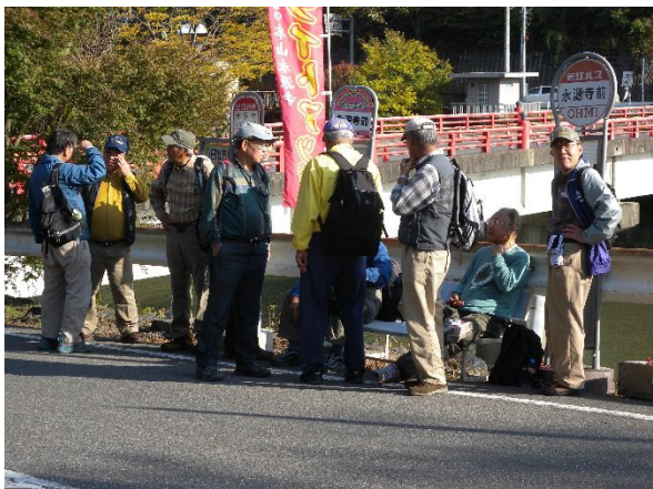
永源寺バス停にて