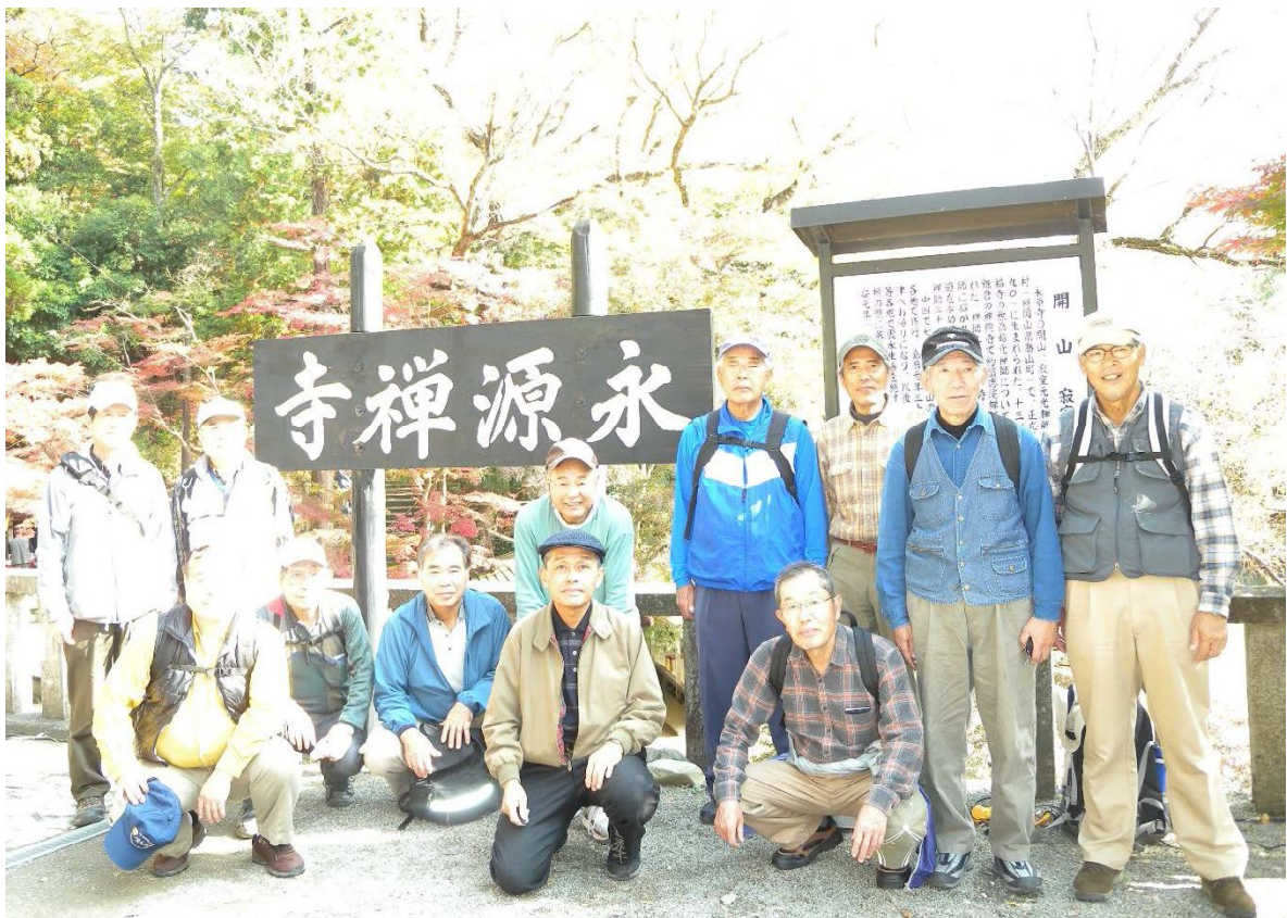
永源寺入口で記念撮影