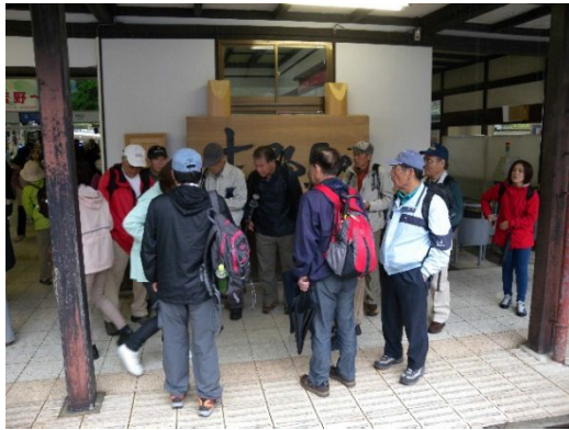
近鉄吉野駅で朝礼