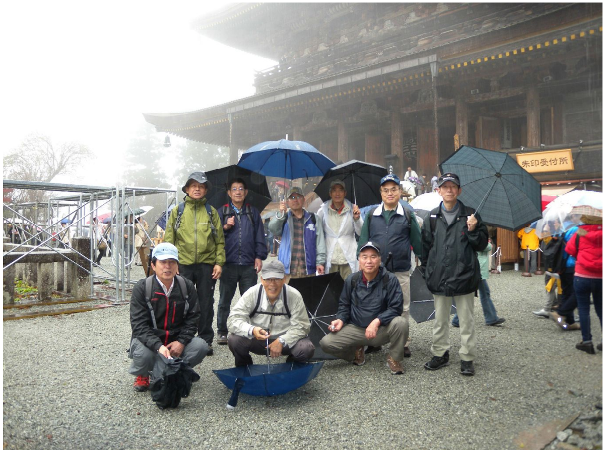
金峯山寺蔵王堂で記念撮影(他に二名様は吉野駅にて待機)