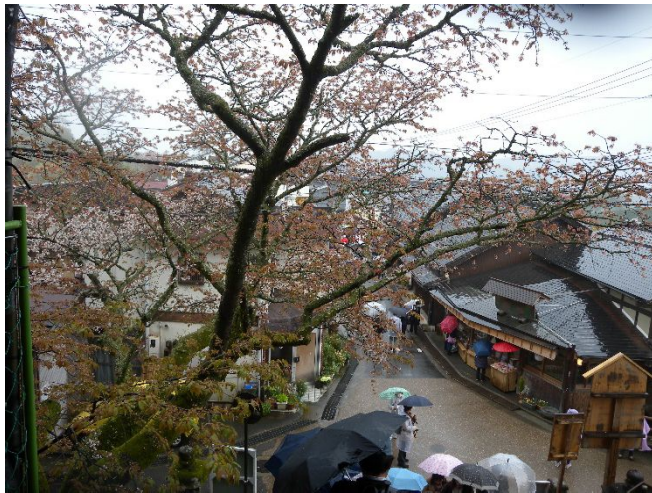
金峯山寺境内より桜