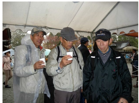
金峯山寺蔵王堂にて御神酒拝たい