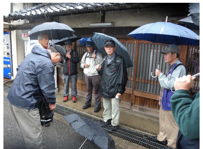
雨のため銅の鳥居前で終礼