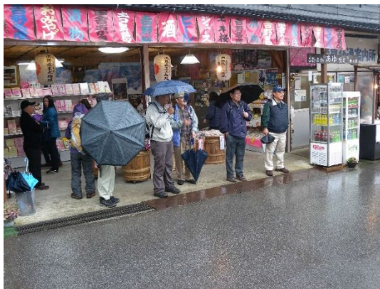
ロープウェイ上駅で待合せ