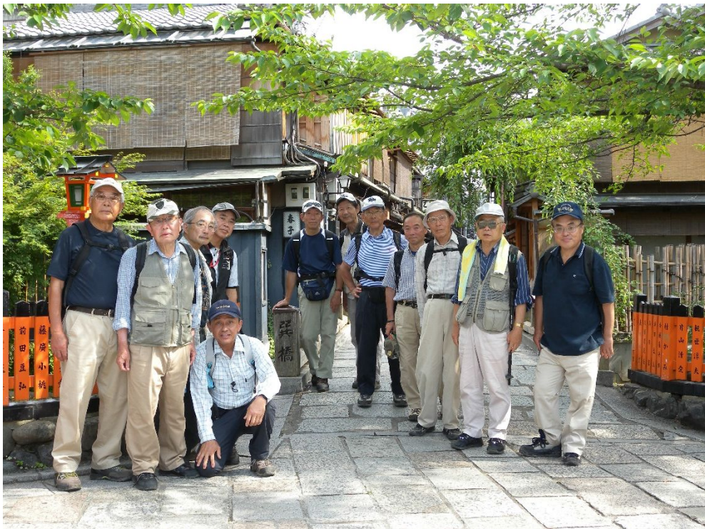
白川の巽橋で解散