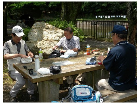
昼ご飯の時間です