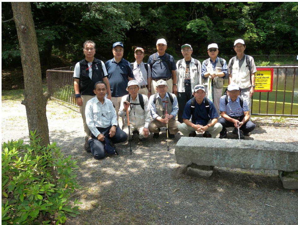
疏水散策路を京都市に入った辺りで記念撮影