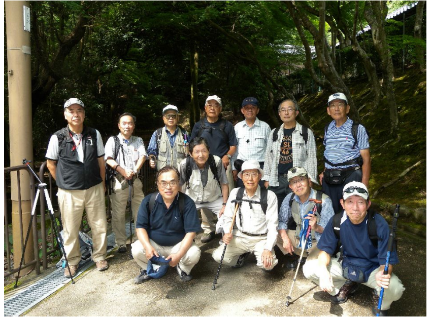
南禅寺奥の院を出て 疏水に出たところで